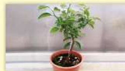
カンキツ類の苗木

詳しくは、事前に裏面★印の植物防疫所にお問い合わせください。なお、現在小笠原諸島には蒸熱処理施設がありません。