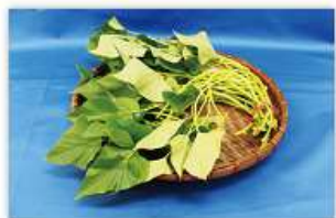
薩摩芋(紅芋など) の生茎葉